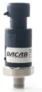
Figura 1: Sensor de pressão 400 bar