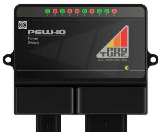
Figura 1: PSW-10