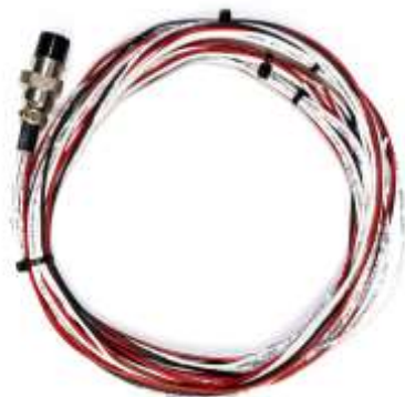
Figura 1: Pré-Chicote CB1000