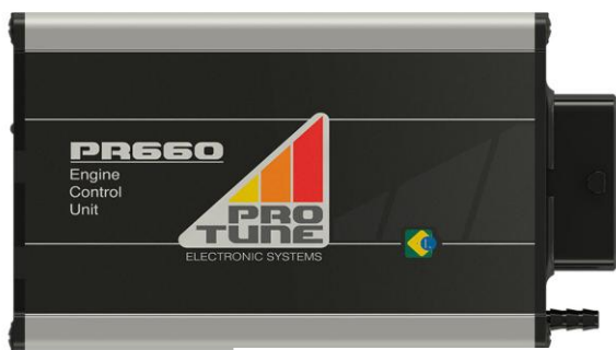
Figura 1: ECU PR660