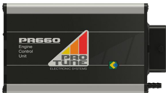
Figura 1: ECU PR660