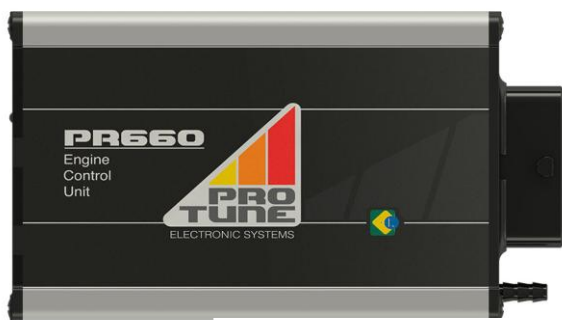
Figura 1: ECU PR660