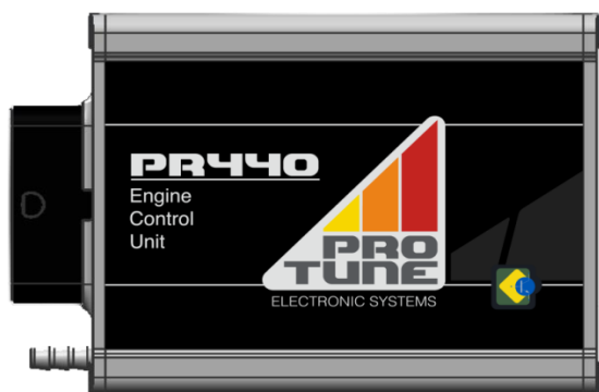
Figura 1: ECU PR440