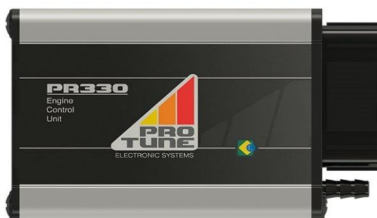
Figura 1 – ECU PR330