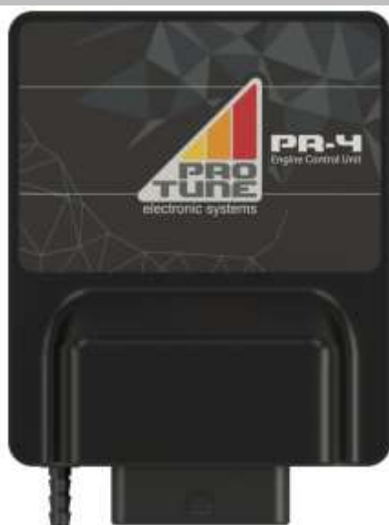
Figura 1: ECU PR-4