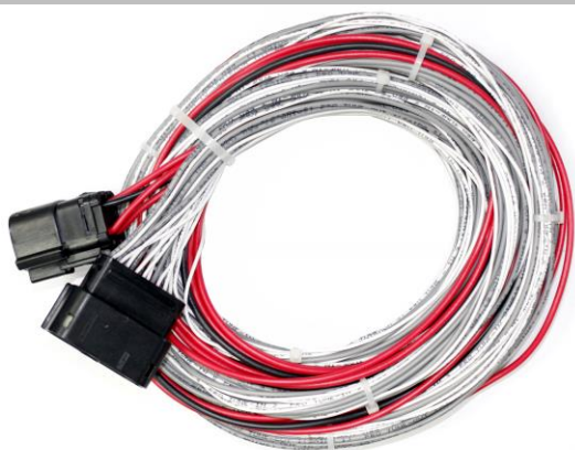
Figura 1: Pré-Chicote PSW-10