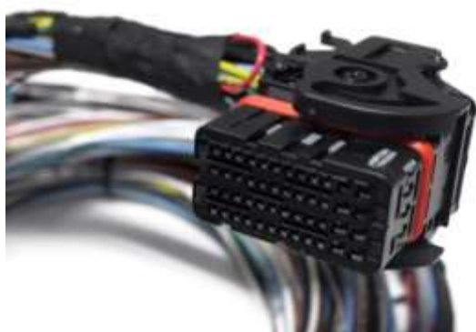
Figura 1: Apresentação pré chicote PR440 / PR-4