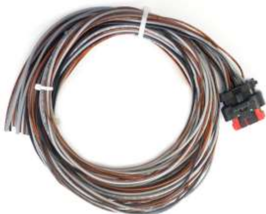
Figura 1: Pré-Chicote IDM 6