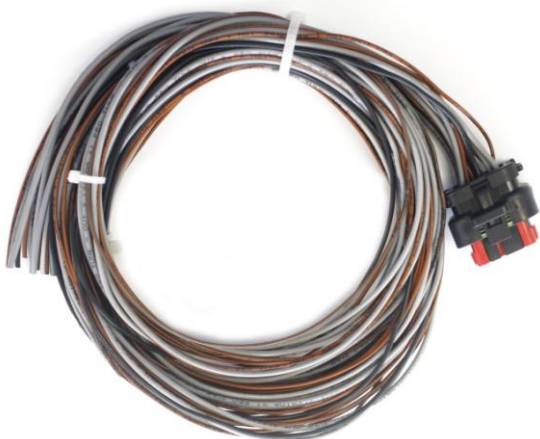
Figura 1: Pré-Chicote IDM 6