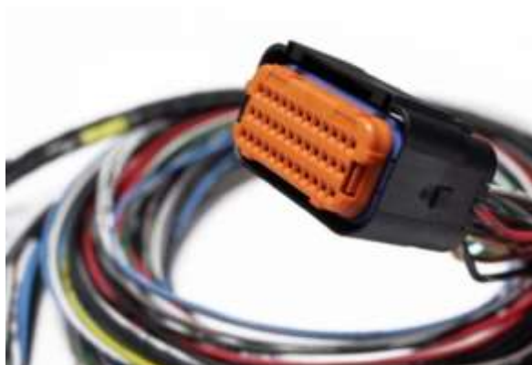
Figura 1: Conector JAE