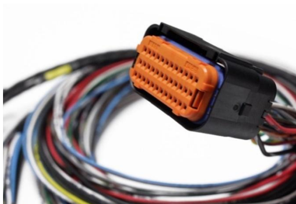
Figura 1: Conector JAE