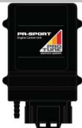
Figura 1 – ECU PR Sport