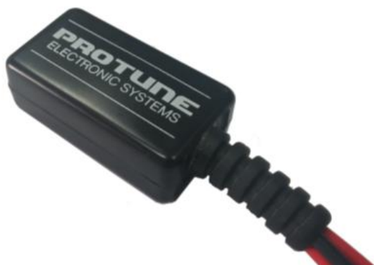
Figura 1: Driver para motor DC 20 A