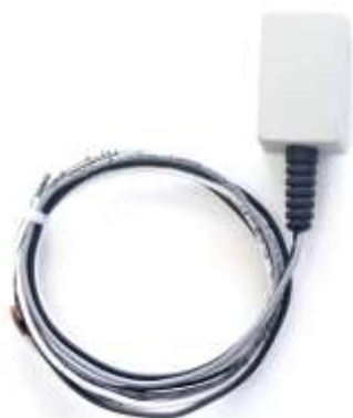
Figura 1: Driver MSD