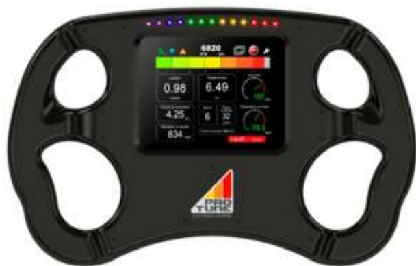
Figura 1: TDL SW 5.6