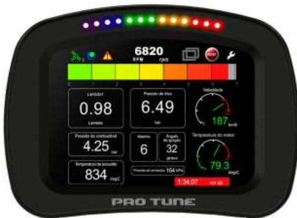
Figura 1: TDL 5.6