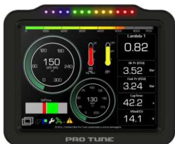
Figura 1: TDL 5.6