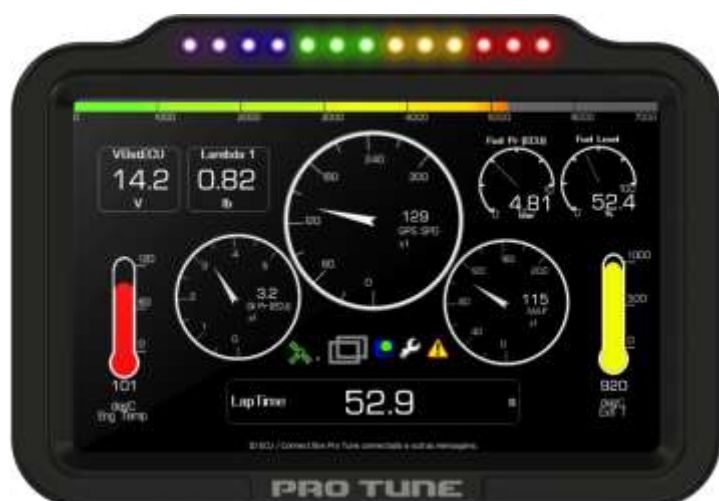
Figura 1: TDL 5.0