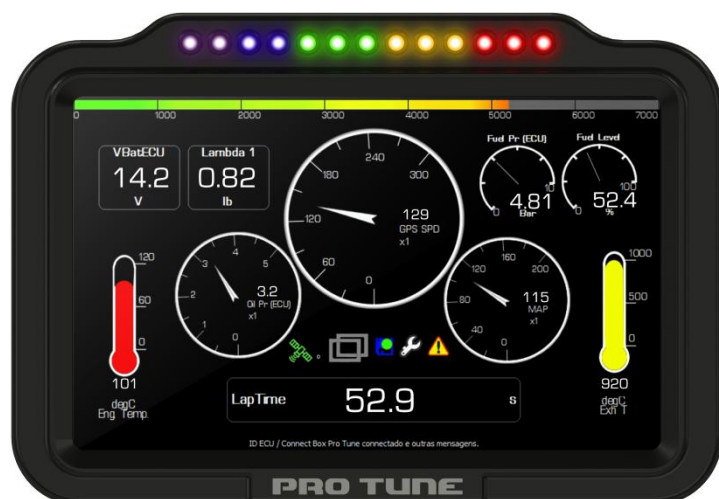
Figura 1: TDL 5.6