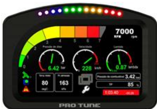
Figura 1: TDL 4.3