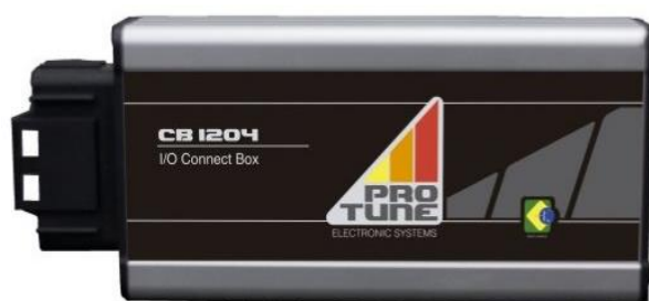
Figura 1: Connect Box 1204